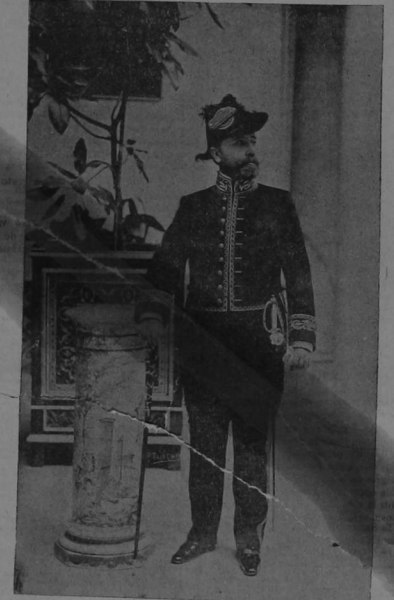
Excmo. señor don Manuel Calderón y Terner

En la poética capital de la tierra andaluza, en Sevilla, se prepara desde de dos años el no me equivoco, un grandioso festival un torneo en las lides del progreso moderno entre España y todas las repúblicas Hispano Americanas que instalarán sus exposiciones en la Planicie donde todos los años se celebra la feria sevillana. Costa Rica tiene un buen amigo en la tierra de María Santísima, el culto caballero señor Calderón, descendiente ó emparentado con la familia de aquel procer de las letras castellanas, Calderón de la Barca, título de nobleza que vale más que muchos otros conquistados con la espada. Es además jurisperito de mérito y honorero el puesto de Cónsul y no necesitamos agregar que funcionarios de su talla honran el puesto que desempeña. Muy grato es para nosotros, consagrar al pie de su retrato estas pocas líneas, en testimonio de la amistad que en época feliz y ya lejána, tuvimos la honra de cultivar con él.