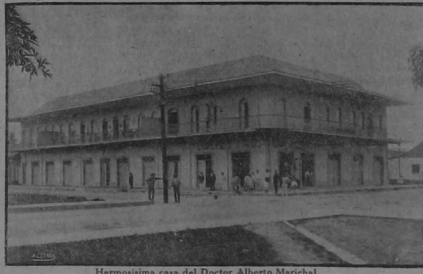
Hermosísima casa del Doctor Alberto Marichal

Suscripción á trajes para caballeros y señoras á colones 1 y 0-50